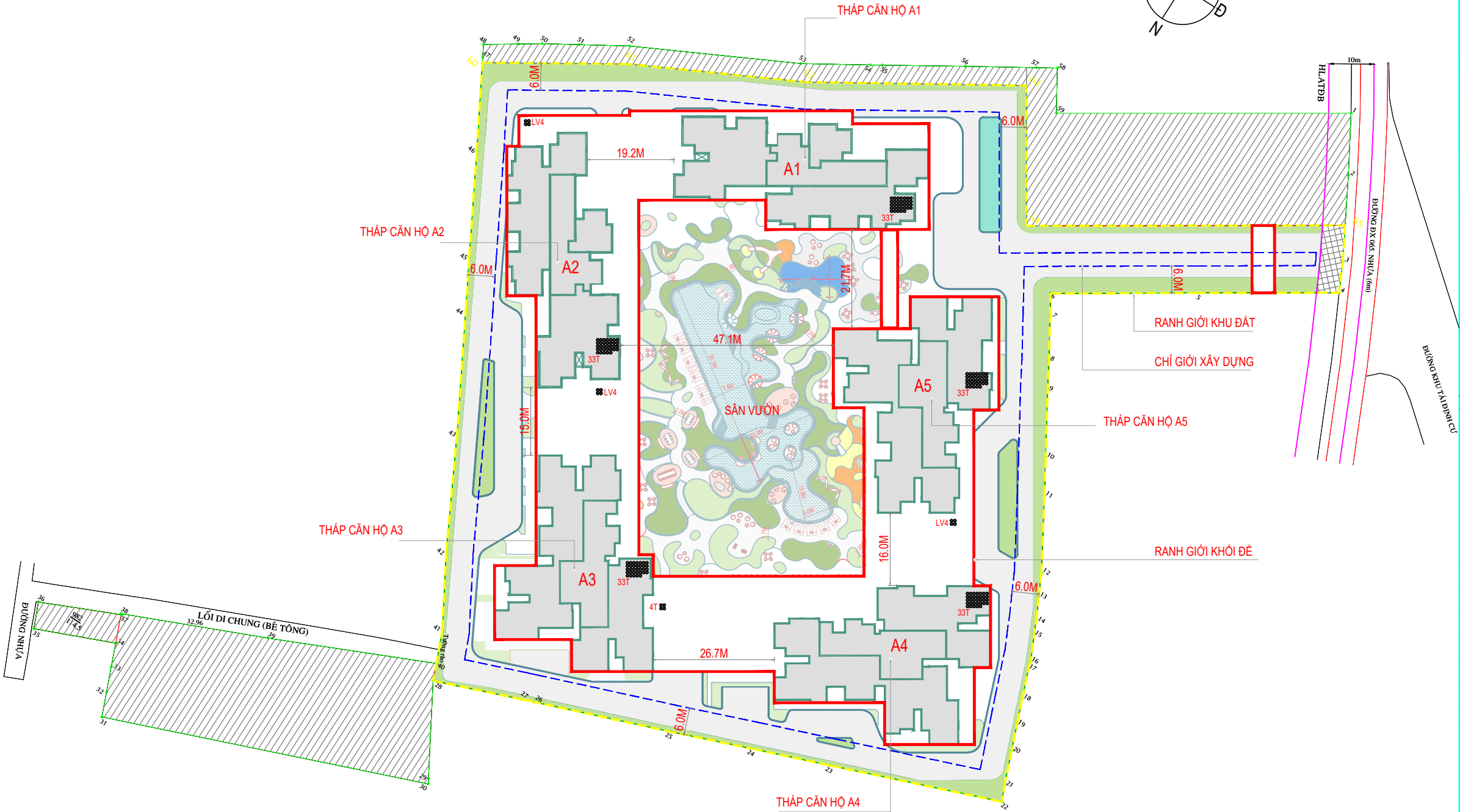
TỔNG MẶT BẰNG